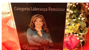
Mulher Destaque na Profissão Contábil