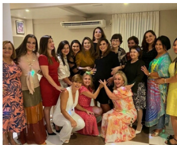
Confraternização Natalina CME