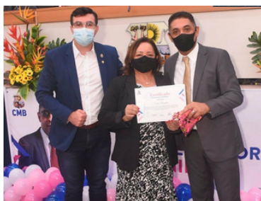
Menção Honrosa Mulheres Empreendedoras